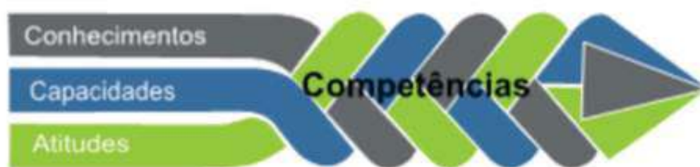
Figura 2 – Esquema conceitual de competência, do projeto 2030 da OCDE (adaptado).

As competências são combinações complexas de conhecimentos, capacidades e atitudes, são centrais no perfil dos alunos, na escolaridade obrigatória. A Figura 2 ilustra este conceito salientando a interligação das três dimensões.